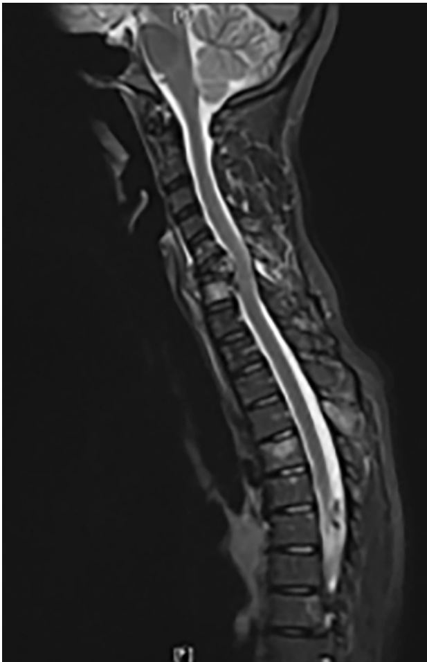
Figura 1. RM de columna en secuencia T2, muestra colapso del cuerpo vertebral C6 con compresión medular.

En la revisión bibliográfica llevada a cabo por los autores se encontró solo un caso reportado previamente de metástasis de adenocarcinoma de parótida a la columna lumbar por Dhaliwal y col. en 2019, siendo el caso reportado aquí el primero con localización cervico-torácica.