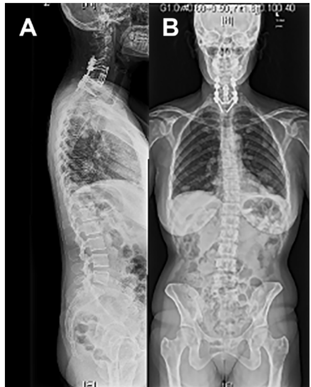
Figura 2. RX de columna completa AP y lateral que muestra corpectomía C6/C7. Estabilización anterior con cage, placa y tornillos. Fijación posterior desde C5-C6 a T1-T2 con barras y tornillos.

Paciente de sexo femenino 48 años, que presenta una historia de 2 años de evolución de otalgia izquierda siendo estudiada por el servicio de otorrinolaringología sin encontrarse causa orgánica. En una visita a odontólogo el examen oral revela inflamación dolorosa en la región parotídea izquierda. La ecografía de la región parotídea mostró un tumor en el lóbulo profundo de la glándula parotídea izquierda. Se realiza biopsia bajo control ecográfico cuyo resultado presentó citología maligna. La RM cervical mostró lesiones osteolíticas, consistentes con infiltración metastásica de los cuerpos vertebrales C5/C6/C7 y T5 con colapso de cuerpo vertebral C6 y retropulsión de fragmento óseo con compresión medular; se observan también metástasis en esternón y pulmones. No